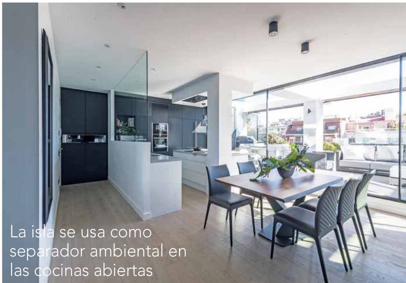
La isla se usa como separador ambiental en las cocinas abiertas